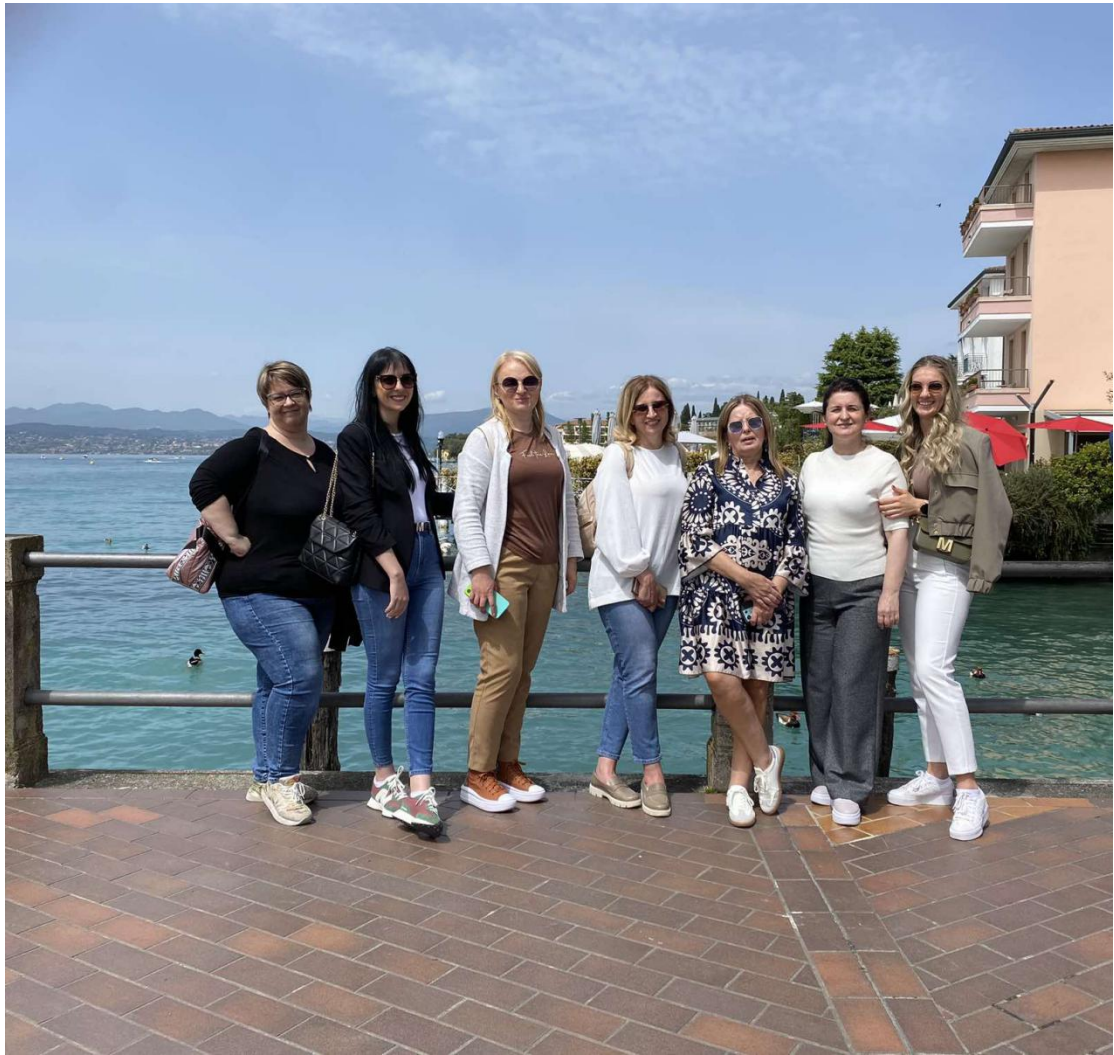
Посетили смо дворац Скалиђеријевих, видели кућу и врт чувене Марије Калас и уживали у јединственом укусу италијанске делиције - сладоледу.